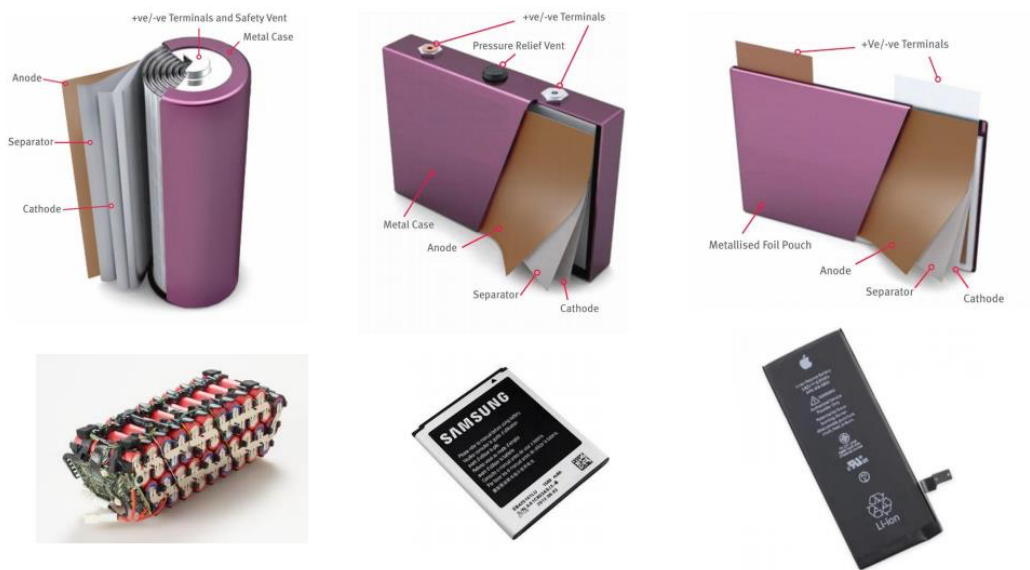
Zie fig. 1 voor de opbouw en werking van een Li-ion batterij.

In een Li-ion batterij zit dus geen puur Lithium. Het is de elektrolyt die het risico op brand verhoogd. Bij een brand gaat de batterij eerst in “thermal runaway”. De aanwezige elektrolyt verdampt, er wordt druk opgebouwd en de gassen die ontstaan ontbranden. Een thermal runaway ontstaat bij: