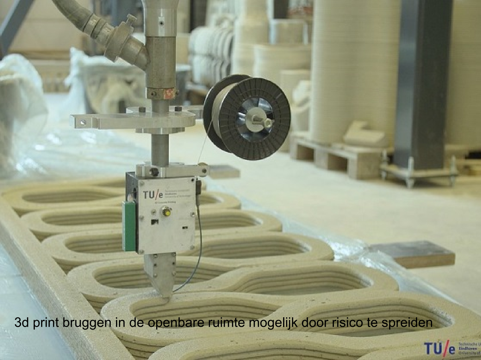
3d print bruggen in de openbare ruimte mogelijk door risico te spreiden